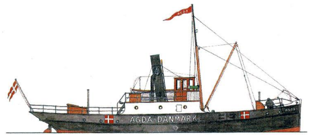
Model af SS AGDA. Står på Endelave Museum.